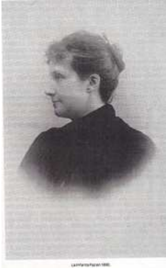
La Infanta Paz de Borbón 1880.

La Asociación Católica Internacional al Servicio de la Juventud Femenina (ACISJF-In Vía) se constituyó en 1904, primero como Asociación Católica, sin ánimo de lucro , organizada en asociaciones regionales; gracias a la labor desinteresada de la Infanta Paz de Borbón, hija de Isabel II y hermana de Alfonso XII. Pero su auge no se alcanzó hasta los años 40.